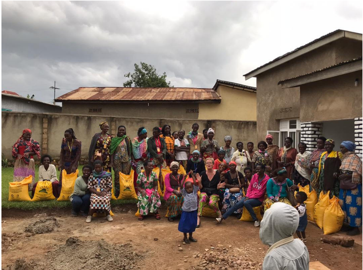
La distribution de riz

Ensuite, c'est pour elles le point culminant de l'année : chacune reçoit un sac de 25 kgs de riz, un des plus beau cadeau qu'on puisse leur faire.